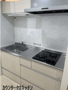
キッチン付キッチン