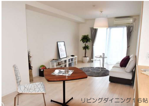
リビングダイニング16帖