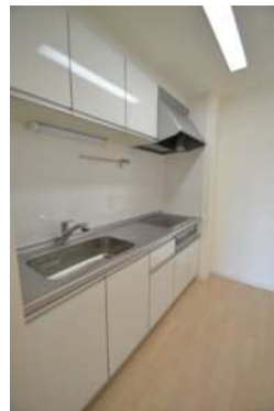
キッチン IH3口（グリル有）