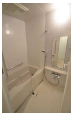
浴室 （浴室乾燥機有）