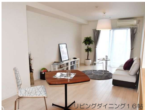
リビングダイニング16帖