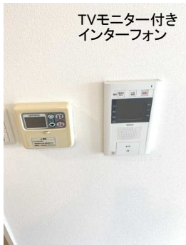
TVモニター付き インターフォン