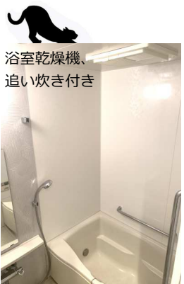
浴室乾燥機、 追い炊き付き