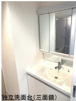
独立洗面台(三面鏡)