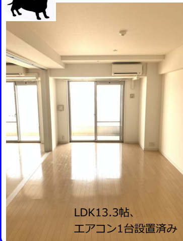
LDK13.3帖、 エアコン1台設置済み