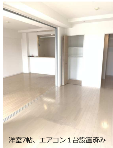
洋室7帖、エアコン1台設置済み