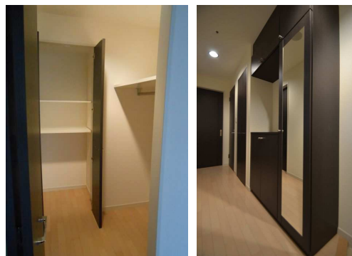
ウォークインクローゼット