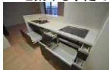
食洗機ついています