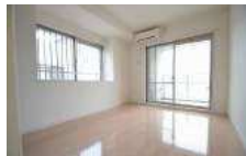
6.8帖洋室※当洋室をLDKと繋げる予定です