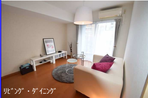
リビング・ダイニング