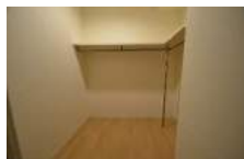
ウォークインクローゼット