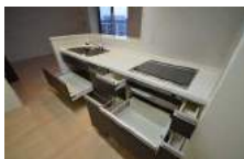
食洗機ついています