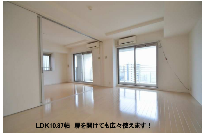
LDK10.87帖 扉を開けても広々使えます！