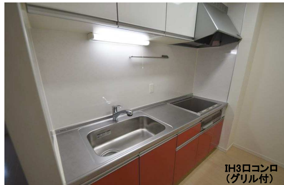
IH3口コンロ (グリル付)