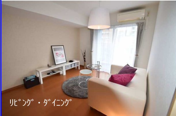
リビング・ダイニング