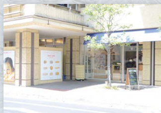
オシャレなショップが多数併設