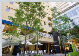
プロムナードの植栽が癒しを演出