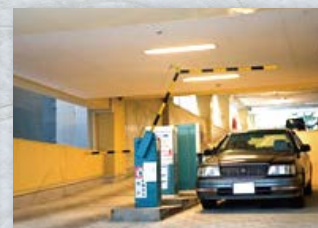
自走式屋内駐車場(153台)