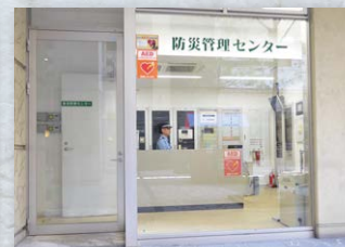
警備員が24時間常駐