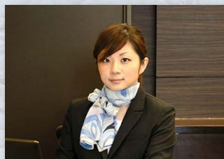
コンシェルジュサービス利用可能