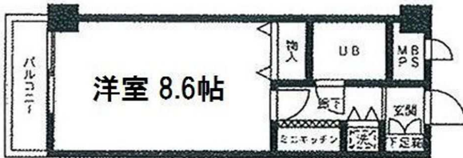
約8.6帖の広々とした洋室